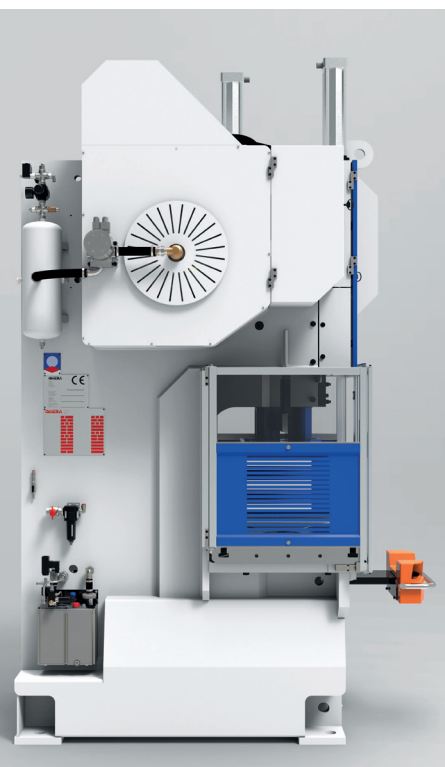
Particolare lato macchina Machine side detail