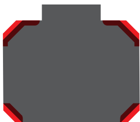
Slitta con quattro guide a V Slide with four V enlarged shape guides

(*) Measured between table and slide with closed die at max. stroke