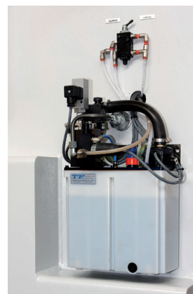
Centralina per sblocco idraulico e lubrificazione Hydraulic unlock system and lubricant system