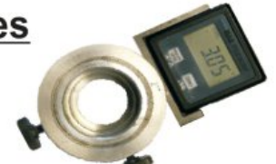
digitaler Verdrehwinkelmesser digital goniometer