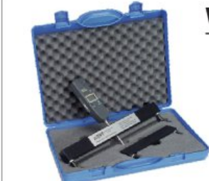
Radienmessgerät radius measuring instrument