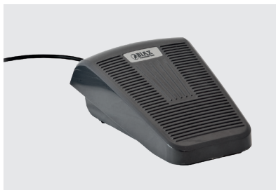
Fußanlasser dynamisch SEFD 50 Bestell-Nr. 001 611 705