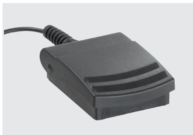
Fußtretschalter Ein/Aus SEFT 50 Bestell-Nr. 001 611 706