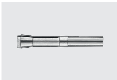
Spannzange Ø 3,0 mm Bestell-Nr. 001 611 708