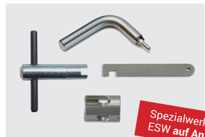
Gegenhalterschlüssel Bestell-Nr. 001 611 711