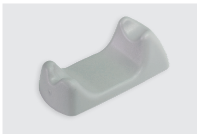
Handstückablage für Schleifer Bestell-Nr. 001 611 710