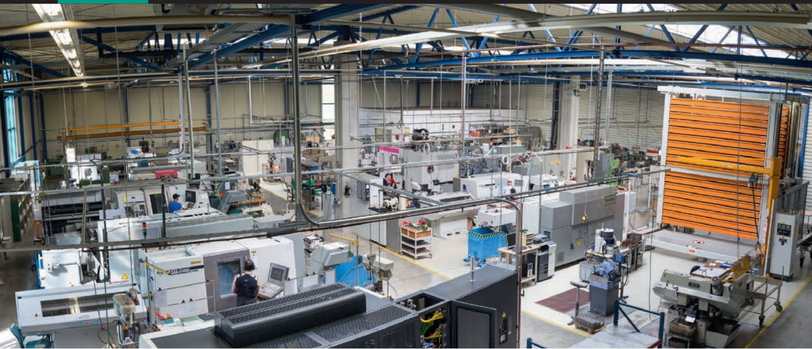
Fertigungshalle Werk Maulbronn