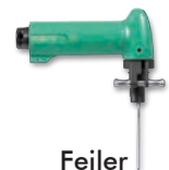
Feiler FR5-827 - 020 000 730