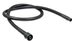
DV6 Flex 032 004 600