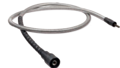
DV7 Flex 032 190 801