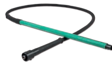
DV6 starr 032 009 400