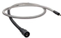
DV7 Flex 030 190 801